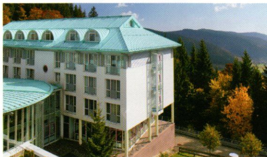
Gelingt gut: Gesundwerden im Caritas-Haus Feldberg

Die Fragen stellte Sabine Schleiden-Hecking.